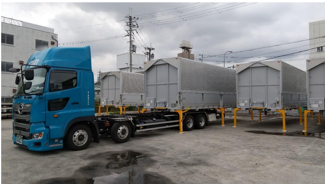
スワップボディコンテナの交換の様子